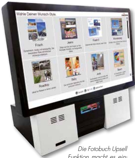
Die Fotobuch Upsell Funktion macht es einfach, die Bilder am Kiosk für ein hochwertiges Echtfotobuch zu nutzen. Dabei können die Nutzer zwischen verschiedenen Styles wählen.

Mit der neuen Kiosk@Home- und Kiosk@Web-Lösung ergänzt Silverlab Solutions die lokale Kiosk-Software mit einer leicht bedienbaren Funktion für Online-Bestellungen. Damit haben die Kunden die Möglichkeit, zahlreiche Bildprodukte in Ruhe zu Hause zu gestalten und Aufträge dann entweder über das Internet für die Herstellung im Fotogeschäft hochzuladen oder die Bestellung auf einem Speichermedium, z. B. einem USB-Stick, in den Laden zu bringen. Das Design der Oberfläche und der Workflow der neuen Lösungen sind identisch mit der lokalen Kiosk-Software, die den Kunden bereits bekannt ist.