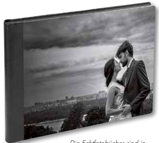
Die Echtfotobücher sind in verschiedenen Formaten erhältlich.

tion macht es Silverlab den Betreibern von Kiosks möglich, ihren Kunden das besonders einfach zu erstellende 4-Klick-Fotobuch anzubieten. Dazu